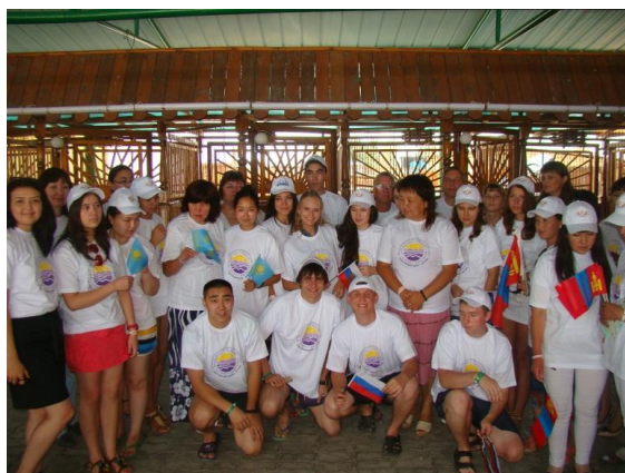
Рисунок 2 – Участники Школы - 2014, Восточный Казахстан, база отдыха «Айгерим».