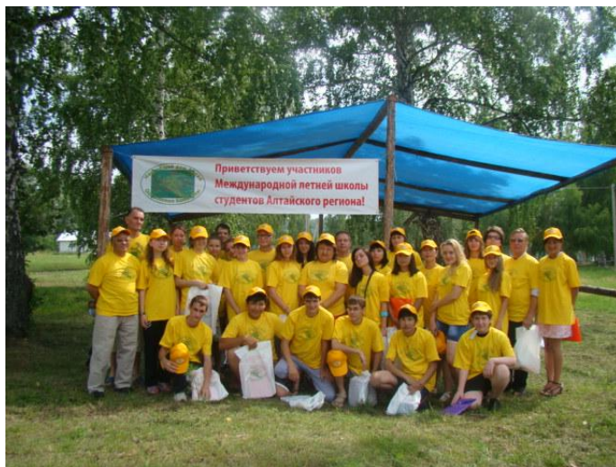
Рисунок 1 – Участники Школы - 2012, база учебных практик Алтайского государственного университета.

Проведение Школы осуществляется поочередно на базе одного из вузов регионов Алтая. За 12 лет Школа состоялась во всех четырех странах Алтая. Обычно часть ее проводится в стенах вуза, а часть – в условиях окружающей природной среды (на базах учебных практик или в близлежащих туристско-оздоровительных комплексах). Примечателен факт, что чаще всего инициаторами и принимающими сторонами школ выступали вузы России и Казахстана (рис. 1).